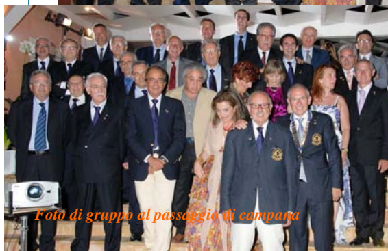
Foto di gruppo al passaggio di consegna