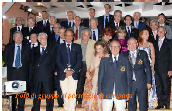
Foto di gruppo al passaggio di consegna